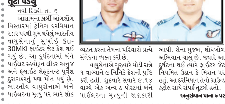
અનુસંદાન પાના ૭ પર

બેરહાટથી ૬૦ કિમી દૂર સુખોઈ ફાયર જેટ વૃદ્ધી પડ્યું